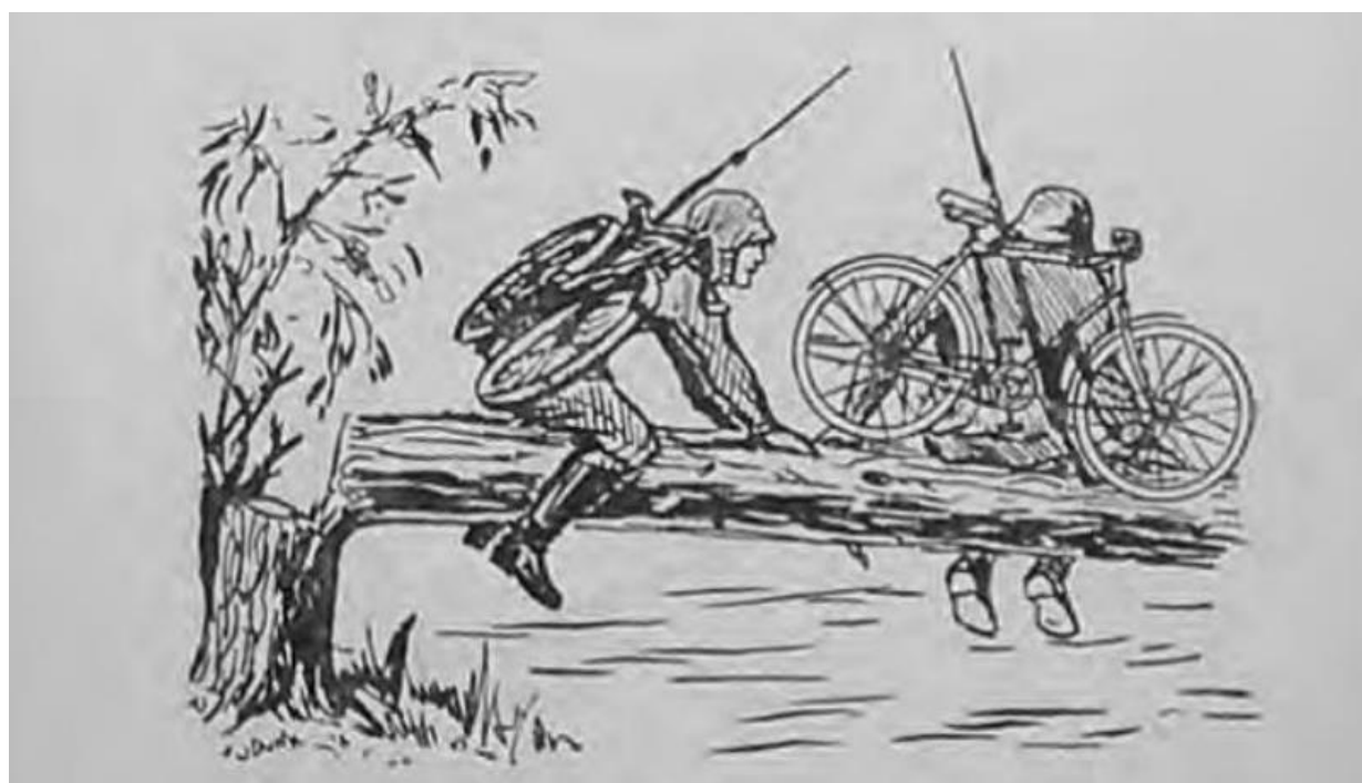
Рис. 3. Передвигаться по бревну, доске можно с «самокатом» за спиной или на плече шагом или бегом, если хорошо развито равновесие , или боком