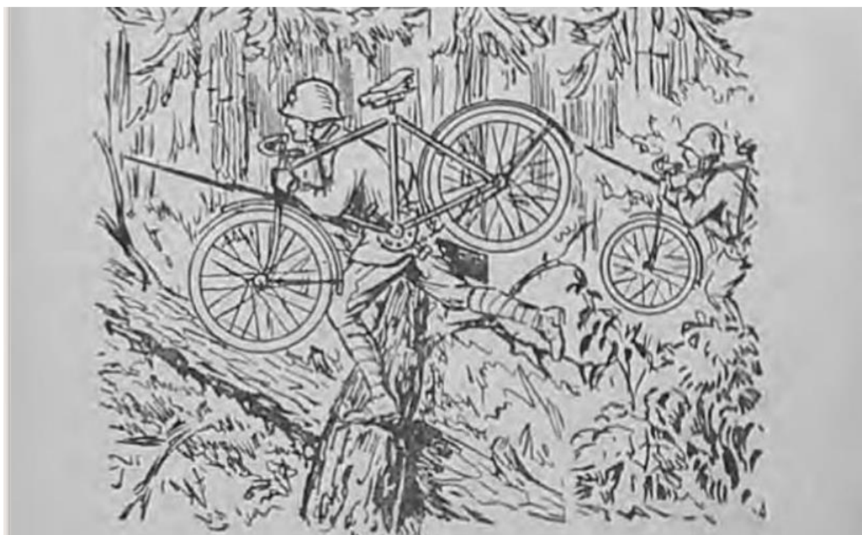
Рис. 2. Преодоление невысоких препятствий с самокатом (велосипедом) в руках или на плече, способом «наступая на препятствие»

Тренировки включали езду на скорость и на выносливость на длинные дистанции.